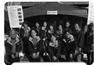
日進市産業まつり