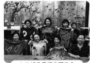
女性部役員視察研修会