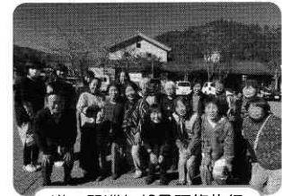
道の駅巡り部員研修旅行