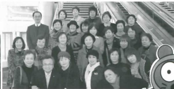
大津プリンスホテルにて