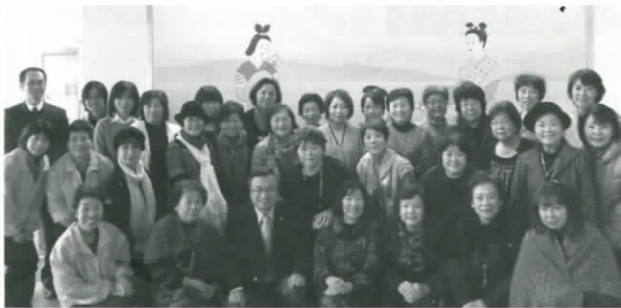
甲賀市商工会女性部の皆さんと共に