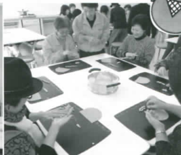
兵糧丸作り体験風景