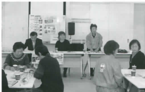
甲賀市商工会女性部との交流会風景